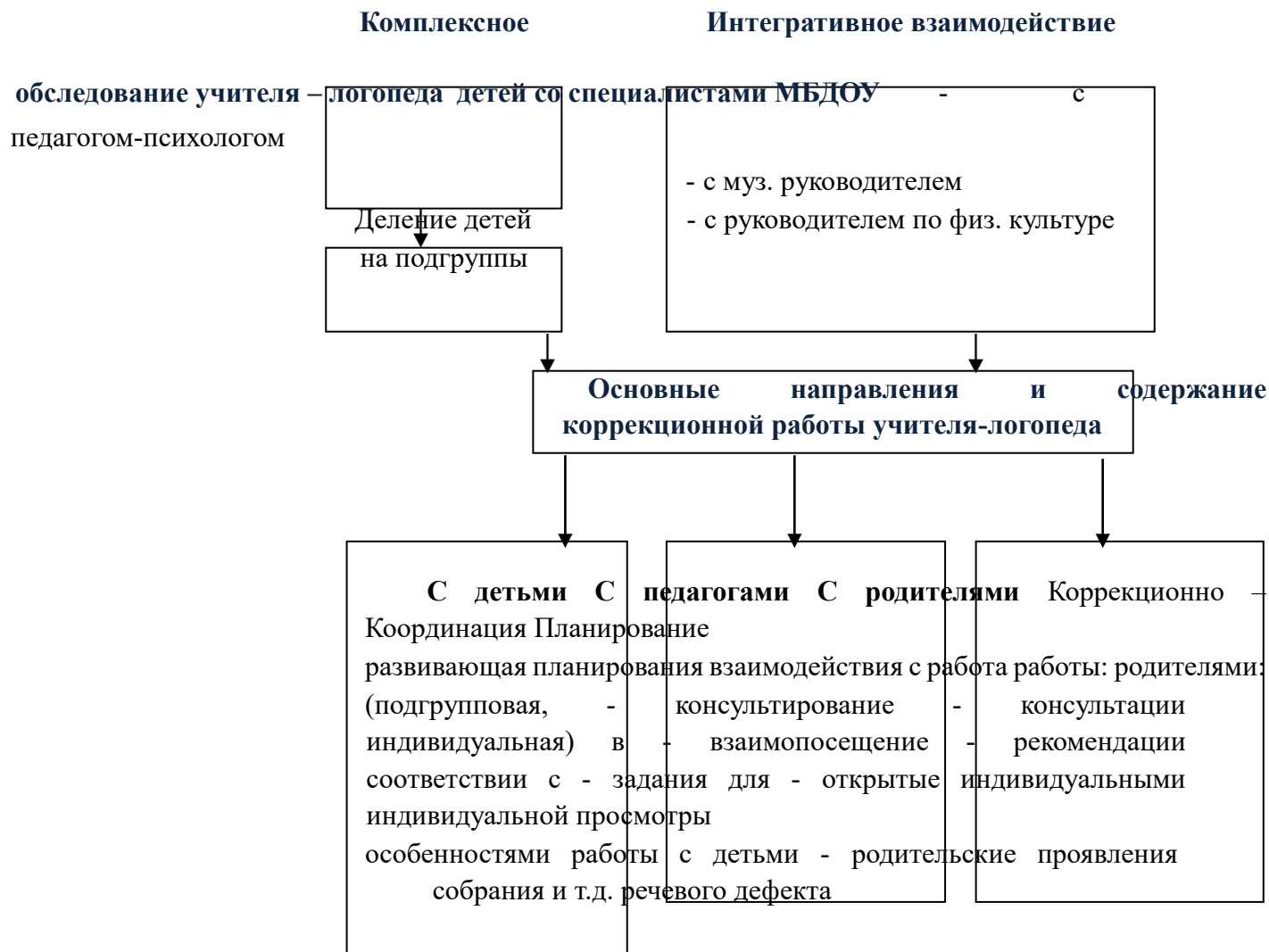
Схема коррекционно – образовательного процесса в МБДОУ № 47

диафрагмально-речевого дыхания, совершенствованием просодических компонентов речи, координации основных видов движений, мелкой моторики руки, над формированием положительных личностных качеств в поведении ребенка: общительности, умения рассчитывать свои силы, над воспитанием самоконтроля, смелости, решительности, отзывчивости и др.