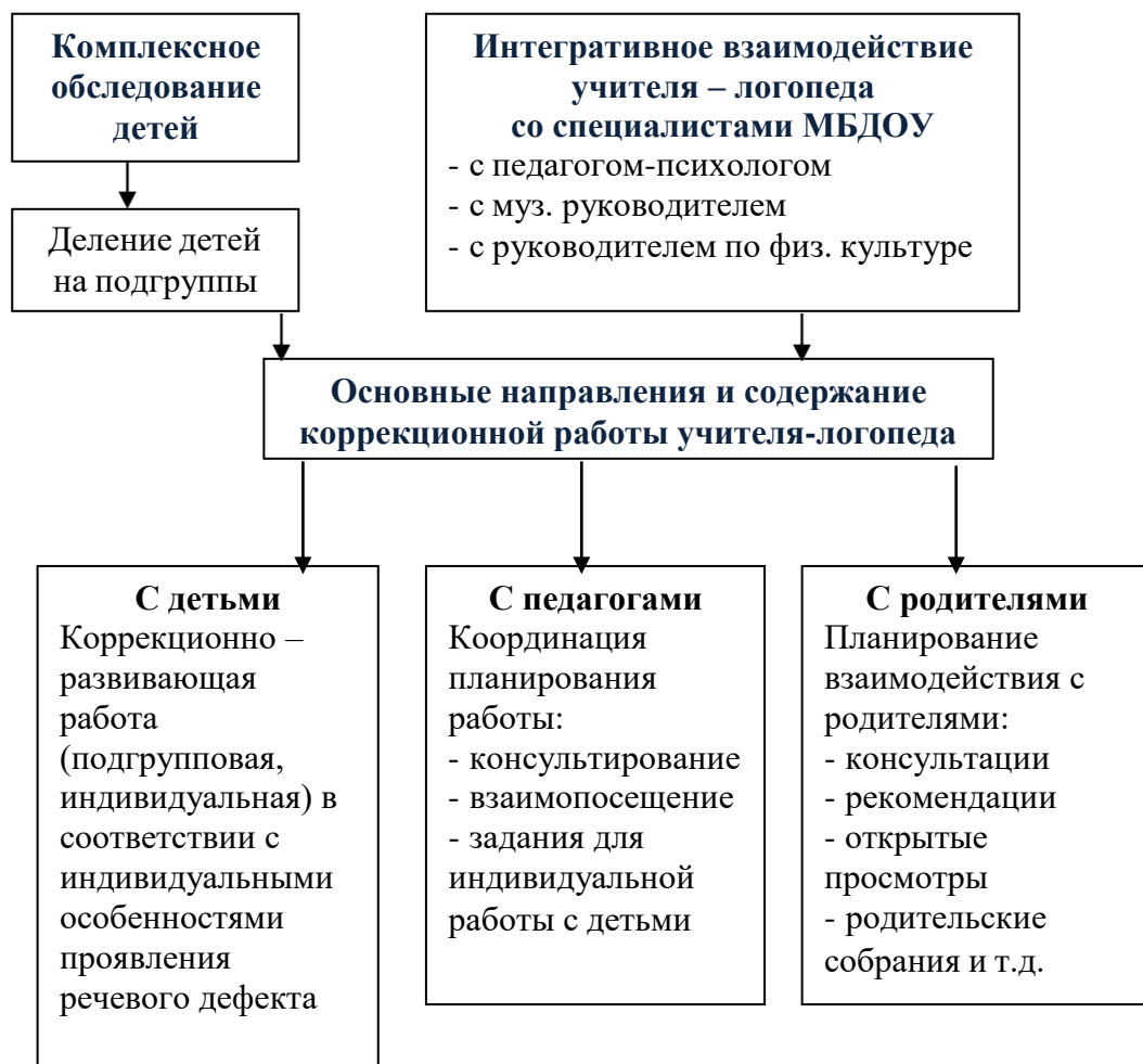
Схема коррекционно – образовательного процесса в МБДОУ № 47