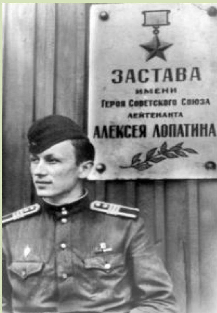
Памятник А. В. Лопатину на заставе

Пусть в памяти нашей вечно живут, Погибшие воины наших границ Те, кто жизнь отдал, честь не сломив, Их души теперь в пении птиц.